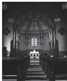
LA SOLITUDE 2016 Photographie Inkjet 80 x 110 cm CHF 400.-