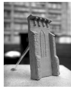
CHURCH - 02 2015 Terre glaise 17 x 8.5 x 5 cm