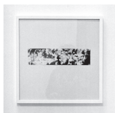
GLOSSO - 02 2015 calligraphie, papier 8 x 24 cm CHF 150.- (avec cadre)