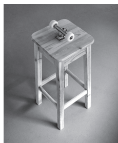
HA HA 2016 Tabouret et roulettes