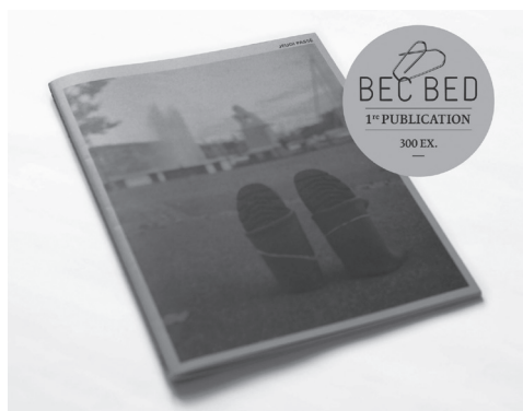
JEUDI PASSÉ | N° 1 2016 Publication BEC BED 68 pages | limité à 300 exemplaires Prix CHF 12.-

Sennett, R.,(2009). La conscience de l'œil, urbanisme et société, Ed. Verdier, p.128-129.