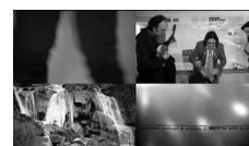
VAVA LES GENOUX HUILÉS 2016 Vidéo 4 min.